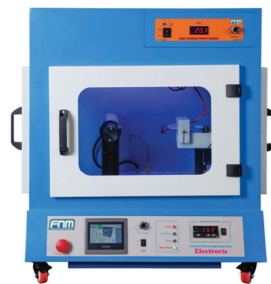
دستگاه الکتروریس تک پمپ